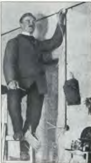
Elektriker fra omkring århundredeskiftet

At belyse klubbens historie er et spejlbillede - både af et lille århundredes samfundsudvikling i Danmark og el-branchens (og Siemens) udvikling fra at være af beskeden betydning til en branche, hvis „produkt“ er blevet en absolut uundværlig del af vores hverdag.