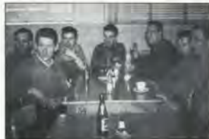
Elektrikersjak, General Motors, Aldersrogade, 1957.

1947 Et uroligt år for klubben! Inden for bare 5 måneder når klubben at have fire forskellige tillidsmænd. Det er givet en uriaspost at være tillidsmand under en lønkonflikt, som det var tilfældet her.